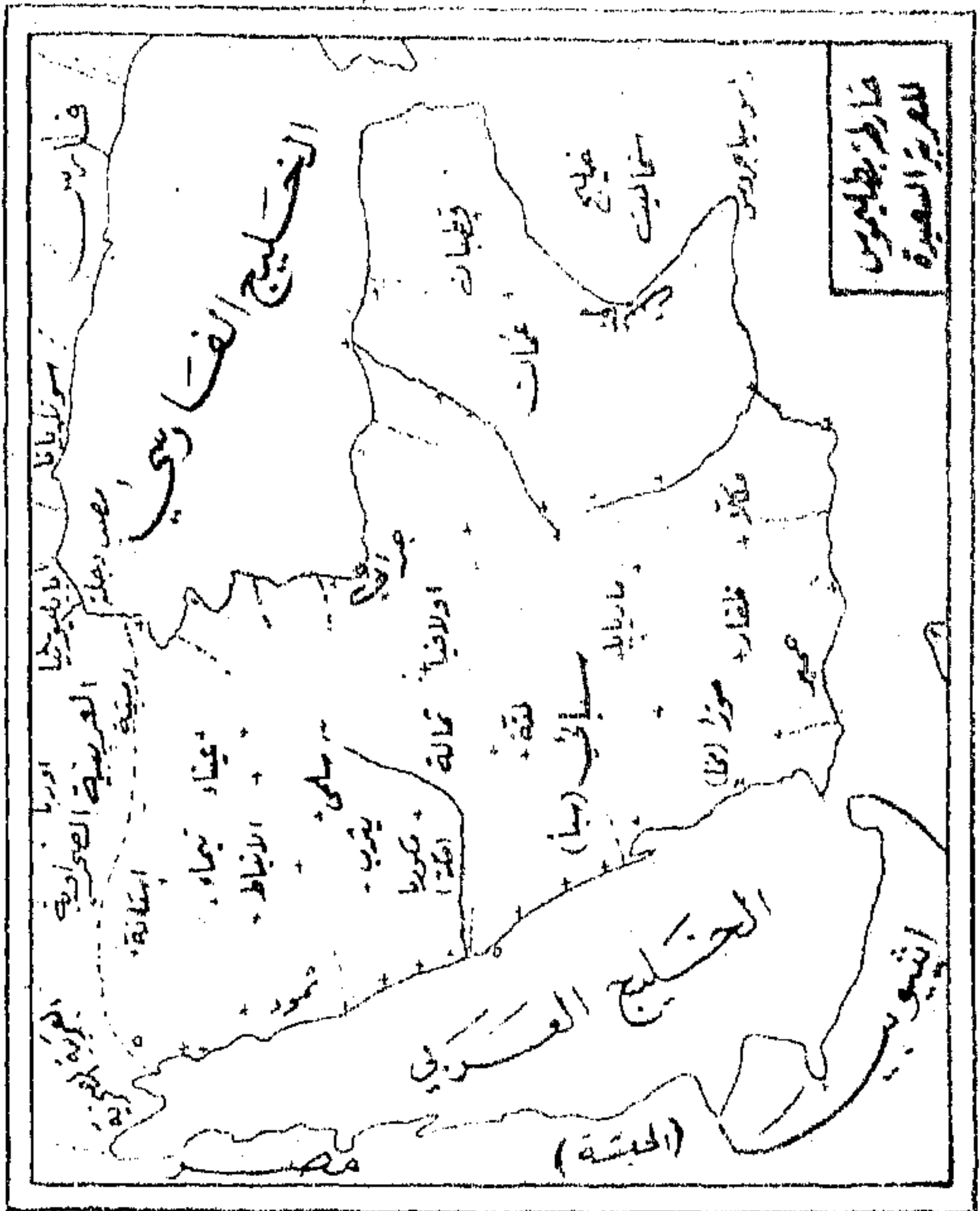
خارطة رقم (6)