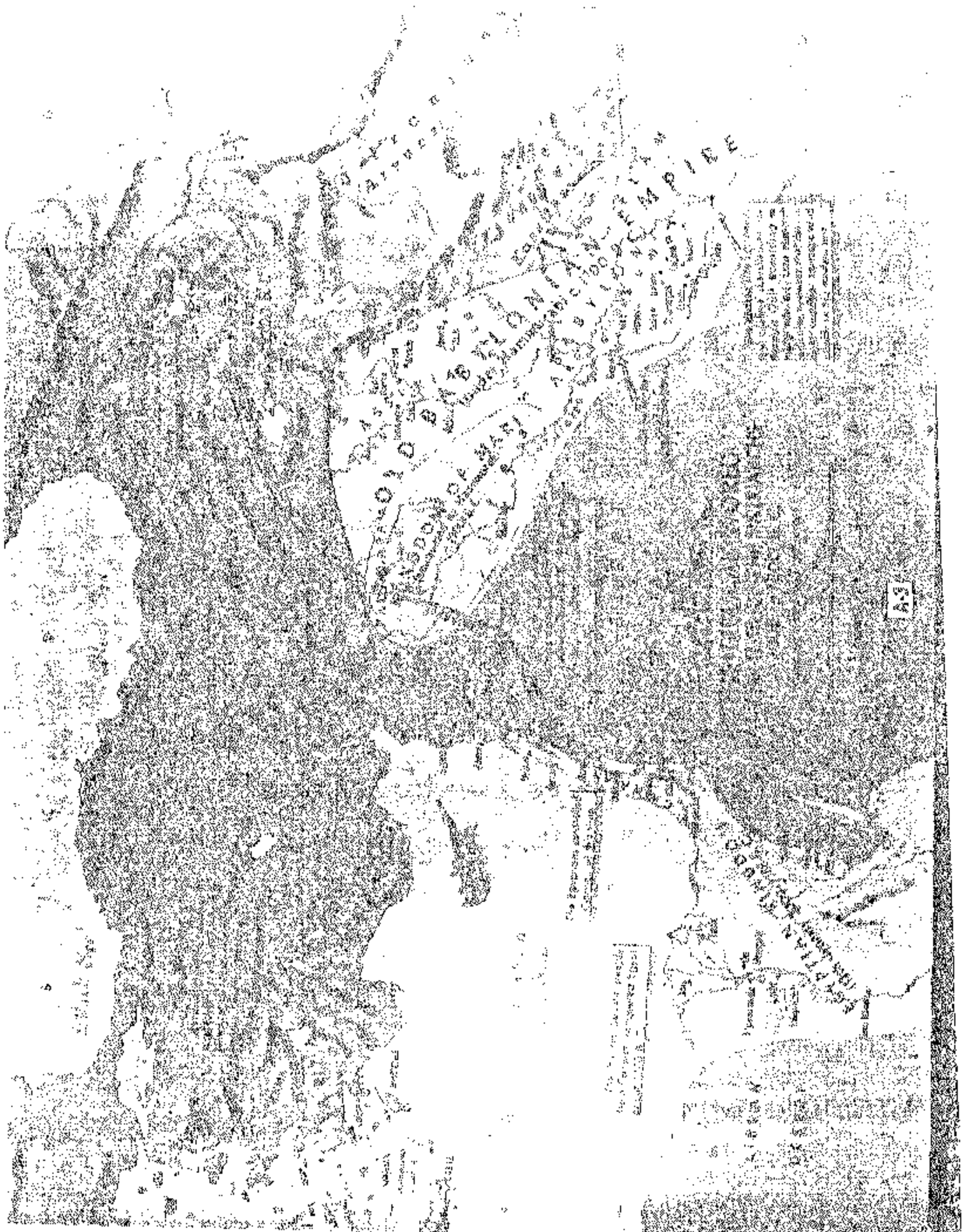
نخارطة رقم (2)